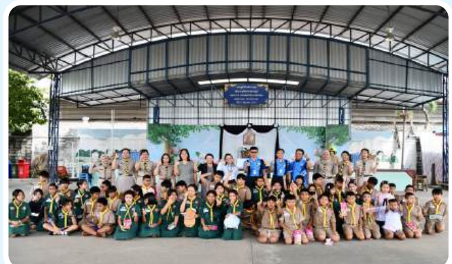
>>ให้ความรู้ด้านความปลอดภัยเบื้องต้น วันที่ 25 พฤศจิกายน 2568 ณ โรงเรียนวัดประชุมราษฎร์ จ.ปทุมธานี