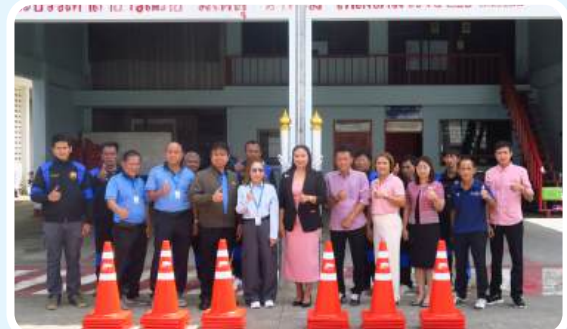
>>สนับสนุนกรวยจราจรให้เทศบาลตำบลหนองแขง วันที่ 23 กันยายน 2568 ณ เทศบาลตำบลหนองแขง จ.สระบุรี