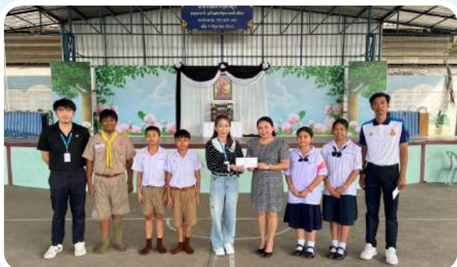
>>สนับสนุนกีฬาสิ วันที่ 4 ธันวาคม 2568 ณ โรงเรียนวัดประชุมราษฎร์ จ.ปทุมธานี