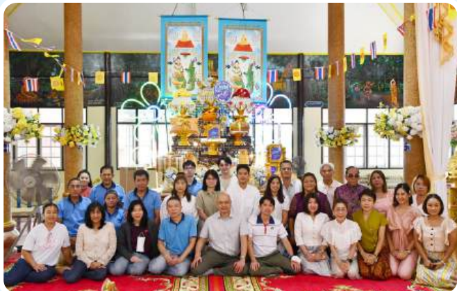
>>กลืนแทปไลน์สามัคคี ประจำปี 2568 วันที่ 19 ตุลาคม 2568 ณ วัดทตราชฎาร์เจริญญณีนฤที ด.บางไผ่ อ.เมืองฉะเชิงเทรา จ.ฉะเชิงเทรา