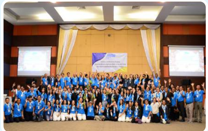
>>กิจกรรม แทปไลน์สายใยสัมพันธ์ชุมชนแนวท้อและคลังน้ำมัน ประจำปี 2568 วันที่ 20-21 พฤศจิกายน 2568 ณ จังหวัดระยอง