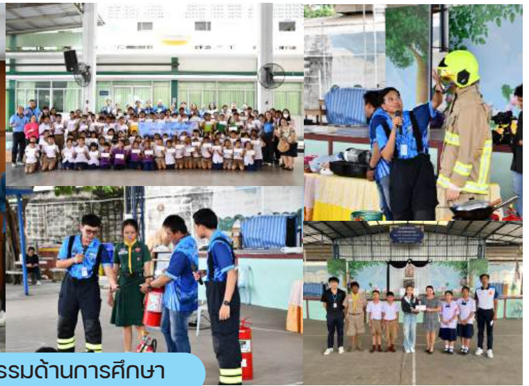
สนับสนุนกิจกรรมด้านการศึกษา

บริษัท ท่อส่งปิโตรเลียมไทย จำกัด หรือแทปไลน์ ดำเนินกิจกรรมเพื่อตอบแทนสังคมหลากหลายด้าน หนึ่งในกิจกรรมที่แทปไลน์ให้ความสำคัญคือกิจกรรมด้านการศึกษา เพื่อเป็นการสนับสนุนโอกาสให้กับเยาวชนในพื้นที่แนวท่อส่งน้ำมันและคลังน้ำมันล่าลูกกาและคลังน้ำมันสระบุรี