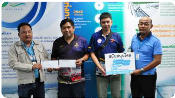
>>สนับสนุนการแข่งขันกีฬาต้านยาเสพติด ปี 9 สหภาพแรงงานรัฐวิสาหกิจรถไฟแห่งประเทศไทย วันที่ 19 กันยายน 2568 ณ คลังน้ำมันสระบุรี จ.สระบุรี