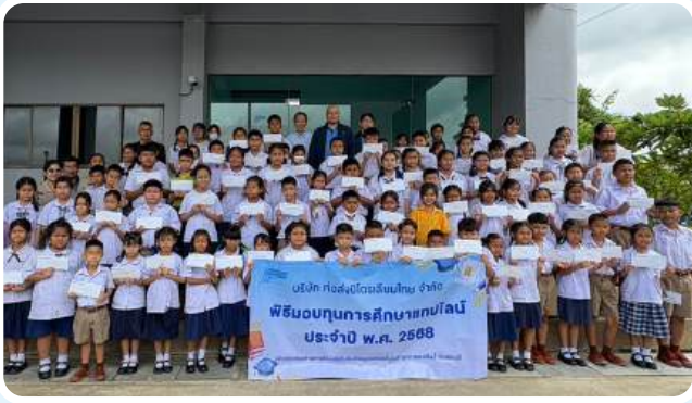
>>มอบทุนการศึกษาแทปไลน์ ประจำปี 2568 วันที่ 8-9 กันยายน 2568 โรงเรียนพื้นที่รอบคลังน้ำมันลำลูกกา จ.ปทุมธานี และรอบคลังน้ำมันสระบุรี จ.สระบุรี